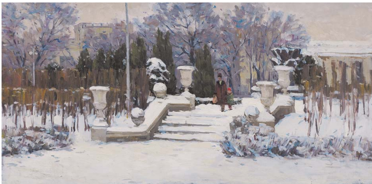
Mihail Petric. Iarnă la Chișinău , u/p, 59,5 × 120 cm, 1963. Din colecțiile MNAM

Cert e că 1812 a fost anul în care s-a rupt firul istoric al teritoriului dintre Prut și Nistru, iar povara acestor consecințe o purtăm și astăzi. Ceea ce au încercat savanții să realizeze în volumul academic prezentat este să reînnoade firul istoric și să găsească soluții pentru problemele concrete cu care se confruntă astăzi societatea. Stăruirea asupra temelor dureroase din istoria noastră permit acceptarea trecutului, educarea personalității concepute ca un individ liber autonom, independent de o lume pe care o influențează fără să o determine, conștient de sine în istorie, solidar cu lanțul timpurilor, incapabil să se conceapă izolat de evenimentele trecutului. Prin analizele făcute istoricii își pot aduce contribuția la capacitatea țării de integrare într-o lume europeană. Dar este mult mai important ca această contribuție să fie utilă celor care iau decizii politice. Lucrarea poate fi numită monumentală și cu siguranță va avea un impact științific important asupra istoriografiei naționale și a celei internaționale, oferindu-i repere explicative examinate și verificate prin prisma rigorilor academice avansate, în speranța că discuțiile sale vor stimula realizarea unui consens istoriografic asupra istoriei noastre naționale.